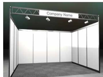
Preis exkl. Fläche: CHF 160.-/m 2